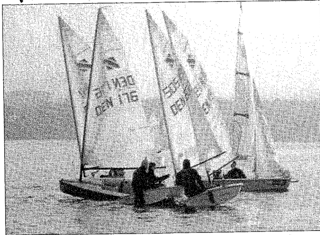
Ventetid for Fjordzoomerne mellem to sejladses ved søndagens Nytårssejlads i Roskilde...